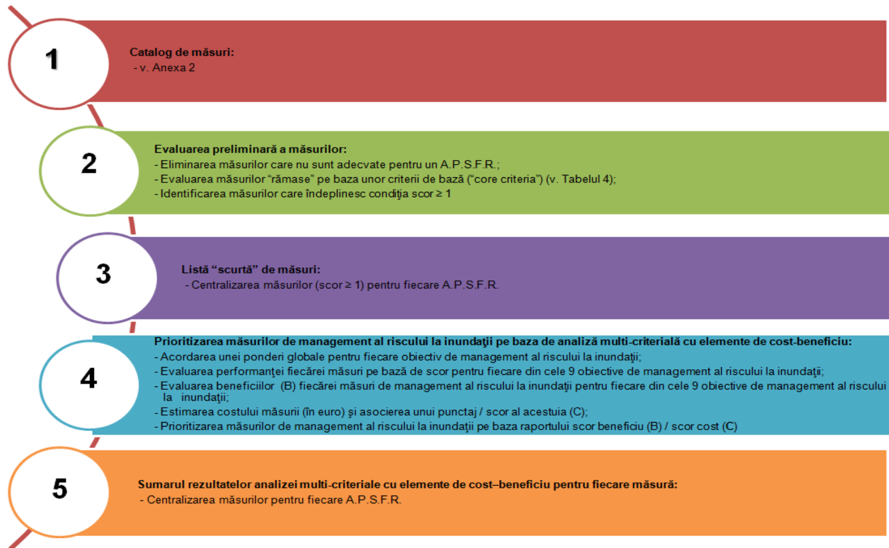
Figura 2. Etape de parcurs în selectarea, evaluarea preliminară și prioritizarea măsurilor la nivel de A.B.A.